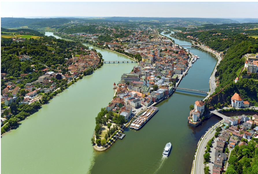
Die Passauer Halbinsel zwischen Inn und Donau heute