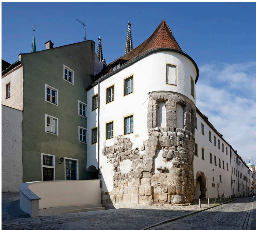
Reste der Porta Praetoria in der Regensburger Altstadt